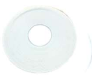
専用発砲マスク ※履厚が均等になり簡単に 施工できるマスク